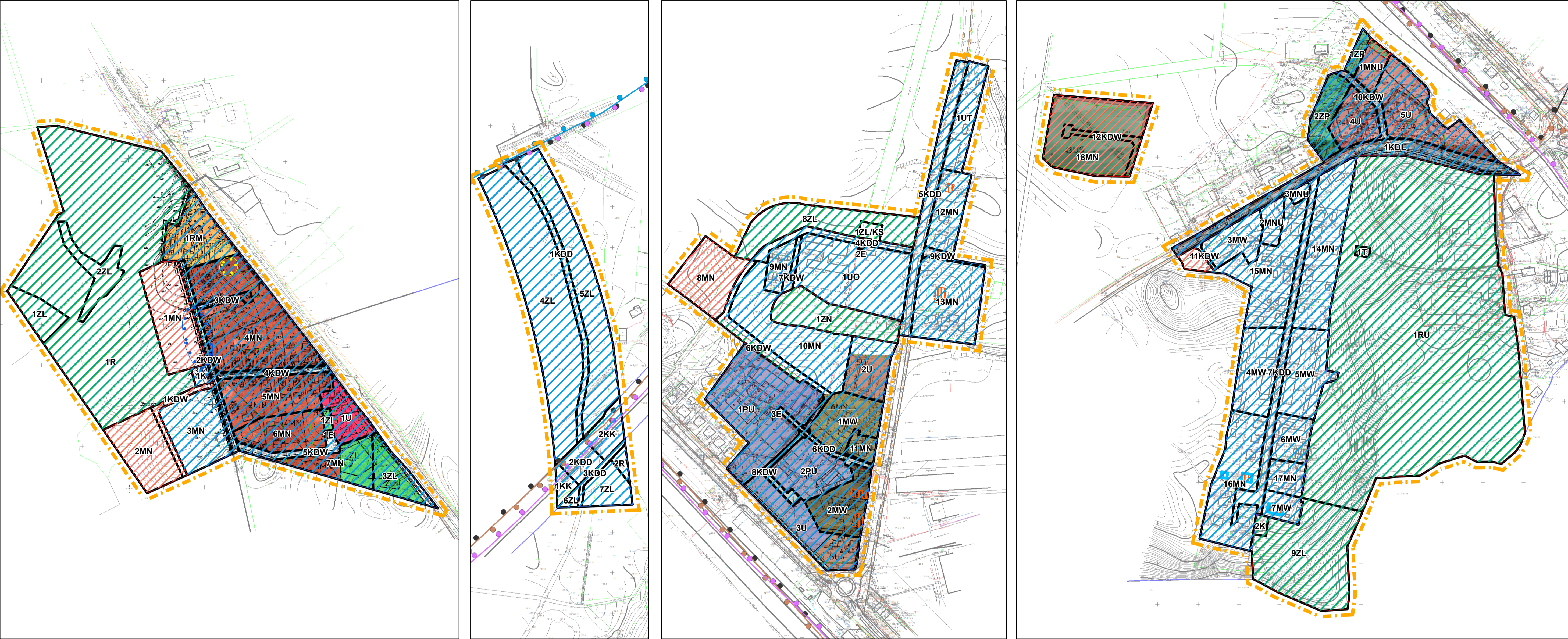
Rys. A Obszar położony na terenie Osiedla Dybówek II