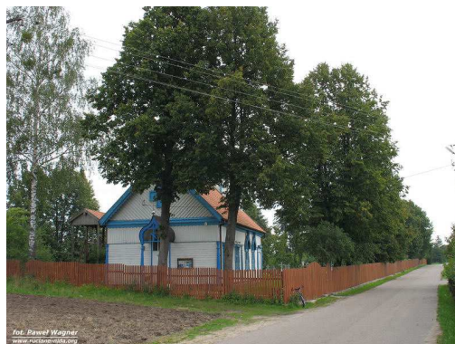
Fot. 19 Cerkiew w Wojnowie.

Współcześnie obrzędy i wierzenia nie giną całkiem ale wskutek zderzenia kultur różnych grup i zachodzących przeobrażeń cywilizacyjnych przetwarzają się, zmieniają swoją formę, a nierzadko i treść. Dawne formy tradycyjne znikają wraz ze zmianą pokoleń dlatego też należy podjąć zharmonizowane działania, które ocalą od zapomnienia niepowtarzalny ślad Wojnowskiej historii. Szczególna ochrona należy objąć ginącą kulturę starowierców, która odchodzi w zapomnienie wraz ze swoimi ostatnimi wyznawcami.