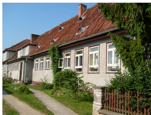
Fot. 21 Budynek byłej szkoły podstawowej w Wojnowie.

Na terenie gminnym, przyległym do byłej szkoły podstawowej, znajdują się dwa boiska sportowe: