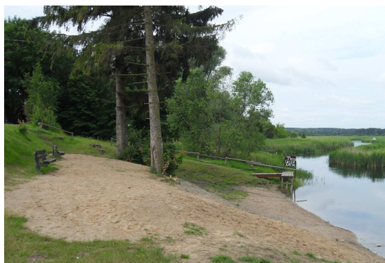
Fot. 3 Kąpielisko wiejskie.

Nad rzeką Krutynią w pobliżu mostu funkcjonuje kąpielisko wiejskie. Zostało one przyjęte jako zwyczajowe miejsce wypoczynku letniego stałych mieszkańców oraz turystów odwiedzających Wojnowo. Plaża w miejscu graniczenia z brzegiem rzeki, na szerokości około 10 metrów, pozbawiona jest roślinności wodnej. Na obszar wykorzystywany do celów rekreacyjnych składa się piaszczyste zejście do wody oraz przyległy do niego teren porośnięty trawą (o powierzchni około 150 m 2 ). Plaża wykorzystywana jest jako punkt przybijania do brzegu uczestników spływów kajakowych, którzy chcą zwiedzić miejscowość.