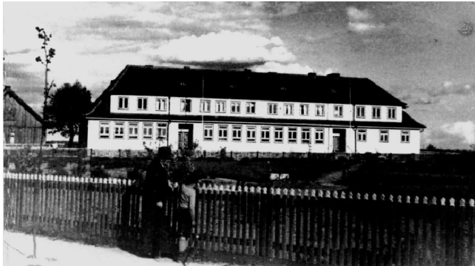
Fot. 20 Po lewej budynek pierwszej placówki oświatowej, po prawej fotografia z 1933 roku przedstawiająca budynek nowej szkoły.