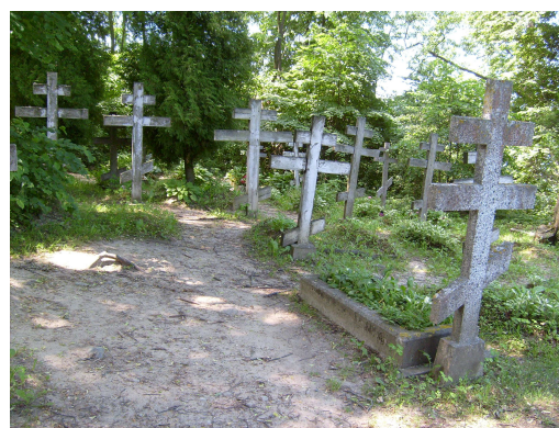
Fot. 12 Cmentarz staroobrzędowców zlokalizowany przy zespole budynków zakonnych w Wojnowie.

Inne krzyże tak zwane Raspiatija (krucyfiksy), spotykane niemal w każdym domu, spełniają podobną rolę co ikony. Mogą być one jedynie grawerowane albo