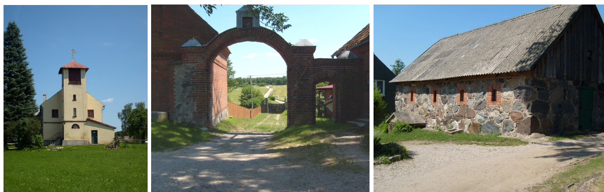
Fot.15 Żeński klasztor starowierców – czasy współczesne.

W 1837 roku staroobrzędowcy, którzy osiedlili się na tych terenach dysponowali świątynią w Ładnym Polu. Zbudowali ją mieszkańcy wsi: Ładne Pole, Osiniak i Piotrowo. Została wzniesiona z surowych okrągłaków i pokryta słomą. Przed wejściem dostawiono dzwonnice z ośmiokończowym krzyżem, do której wchodziło się z przedsionka świątyni. Pod dwuspadowym daszkiem zawieszane były początkowo biła - drewniane i metalowe, a potem dzwony . Ostatnie nabożeństwo odbyło się w niej w 1915 roku. W 1935 roku molennę rozebrano.