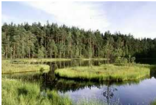
Fot. 7 Rezerwat Sosna Królewska.

Strzałowo - rez. leśny, pow. 14,12 ha; utworzony dla zachowania fragmentu lasu mieszanego. Spotykamy tu sosny o ładnym pokroju i dużej wysokości - 33 m.