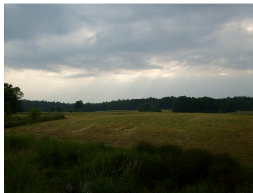
Fot. 9 Łąki okalające Wojnowo.