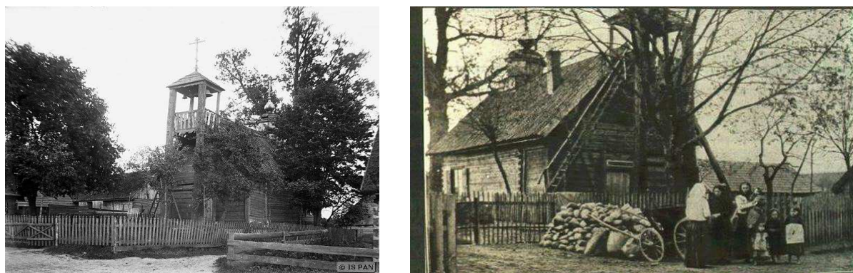
Fot. 16 Molenna Wojnowska - Stan przed pożarem w 1921 r.

W 1846 roku wybudowano w Wojowie większy kościół z dzwonnice o wymiarach: 10 m długości, 6 m szerokości, i 5 m wysokości. Daszek na dzwonnicy był czterospadowy i wchodziło się do niej z zewnątrz po specjalnej drabinie, żeby uruchomić trzy dzwony. Na tylnej części dachu molenny, na kwadratowej podstawie umieszczona została kopulasta wieżyczka z ośmiokończowym krzyżem wysokości 12 m.