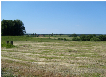
Fot. 4 Okolice Wojnowa.