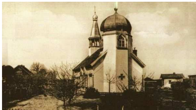
Fot. 18 Cerkiew prawosławna – Wojnowo 1940 r.

W Wojnowie znajduje się także cerkiew prawosławna. Stoi ona w północnej części wsi. Wykonana jest całkowicie z drewna.