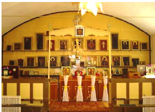
Fot. 17 Po lewej stronie molenna Wojnowska, po lewej stronie ikonostas.