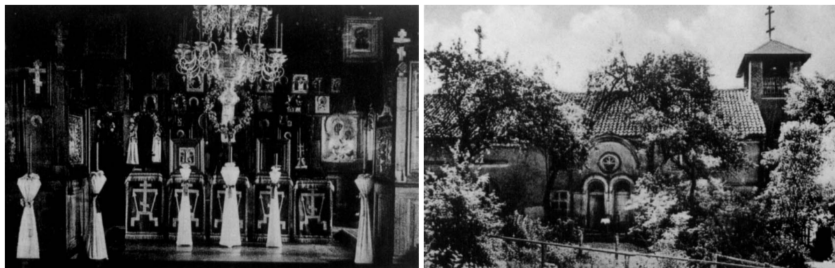
Fot.14 Klasztorna molenna – czasy międzywojenne.