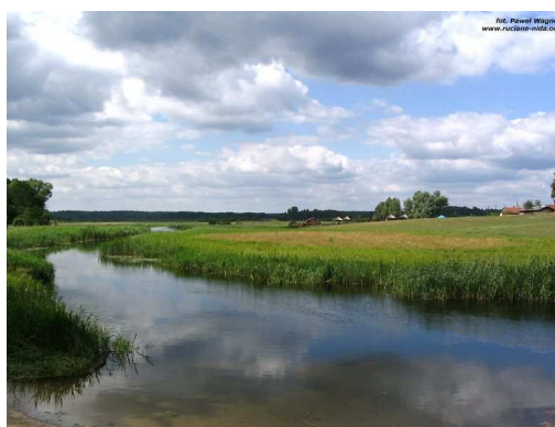
Fot. 6 Rzeka Krutynia przepływająca przez Wojnowo.