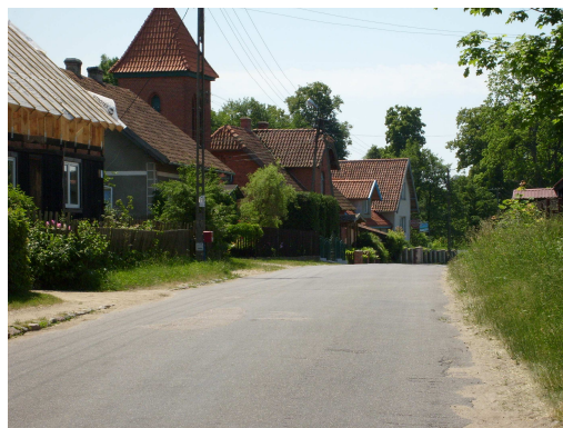
Fot. 23 Droga powiatowa nr1642N

W Wojnowie wzdłuż drogi powiatowej brak jest chodnika. Pilnym zadaniem dla zwiększenia funkcjonalności wsi jest wydzielenie ciągu komunikacji pieszej łączącego najważniejsze elementy miejscowości. Zakładana inwestycja przyczyni się do poprawy bezpieczeństwa, podniesie atrakcyjność zamieszkania oraz zwiększy dostępność wsi dla odwiedzających.