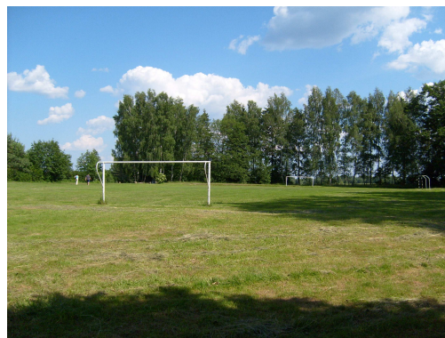
Fot. 22 Boiska sportowe przyległe do szkoły podstawowej w Wojnowie.