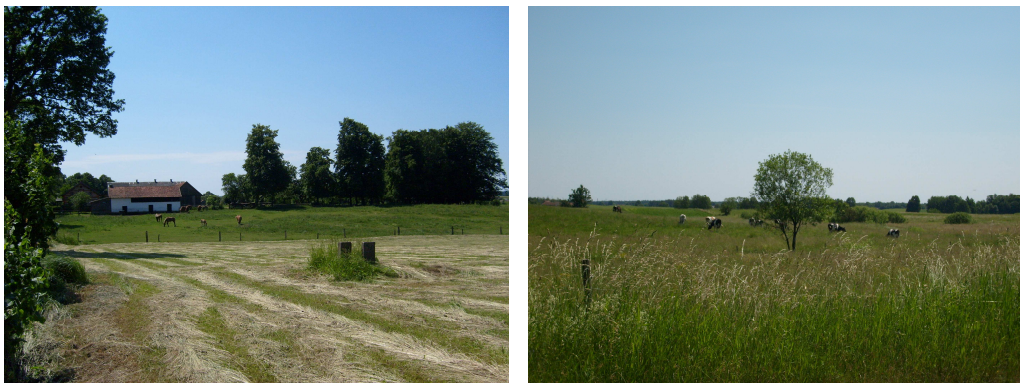
Fot. 11 Łąki i pastwiska przyległe do Wojnowa.

prowadzeniu uprawy ornej. Warunki naturalne określiły formę użytkowania ziemi skierowaną na trwałe użytki zielone prowadzone na potrzeby produkcji zwierzęcej.