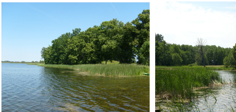
Fot. 8 Roślinność wodna Jeziora Duś.

Istotnym składnikiem flory okolic Wojnowa jest roślinność wodna, której sprzyja obfitość wód stojących i płynących. Jest to najbardziej naturalna postać roślinności tego obszaru, dostosowana swoim składem gatunkowym do stosunków ekologicznych siedliska, przede wszystkim stosunków odżywczych i tlenowych.