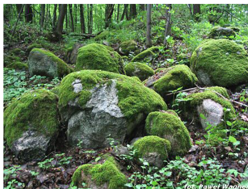
Fot. 10 Głazowiska okolic Wojnowa.

Rosocha - Wojnowo - ścieżka prowadzi przez głazowiska koło wsi Rosocha i wsi Wojnowo, wchodzące w skład moreny czołowej, ciągnącej się wzdłuż drogi Zgon - Ruciane. Można porównać tu morenę czołową zbudowaną z dużych bloków skalnych z sandrową równiną, rozciągającą się na południe od szosy Zgon - Ruciane. Długość ścieżki ok. 3km. Znajduje się jedno z największych głazowisk na Mazurach. Na powierzchni 9 ha znajduje się tu ok. 13500 głazów. Ochroną objęto pojedyncze głazy narzutowe.