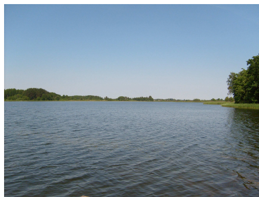
Fot. 5 Jezioro Duś.

Młody, urozmaicony krajobraz polodowcowy tego terenu znamionuje bogactwo hydrologiczne. Wysoką wartością przyrodniczą i przydatnością dla rekreacji i turystyki wyróżnia dwa jeziora zlokalizowane w bezpośredniej bliskości Wojnowa.