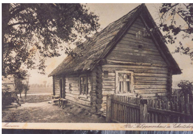
Fot. 13 Dom Starowerski – Wojnowo 1900 r.

Miejscowość wyróżniają się bardzo dobrze zachowanym układem przestrzennym, z wyraźnym zaznaczeniem architektury drewnianej. Starowiercy, w odróżnieniu od Mazurów, budowali domy z drewna, początkowo z nieociosanych kłód, później z bali. Materiał pozyskiwany z wyrębu był aż do czasów najnowszych podstawowym materiałem budowlanym, tym bardziej, że staroobrzędowcy, chcąc chronić czystość swej wiary, na miejsca osiedlania wybierali głównie niedostępne tereny leśne. Dom składał się zwykle z dwóch izb połączonych sienią. Dwuspadowe dachy nakrywano trzcina bądź słomą, potem gontem i dachówką. We wschodnim rogu izby stał ikony. Ten zwyczaj w rodzinach starowierskich zachował się do dnia dzisiejszego.